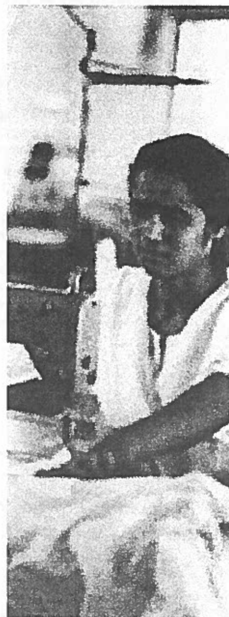
Trabajadora de la confección en Bangladesh

Con la entrada de China en la OMC y la próxima eliminación de cuotas en 2005 bajo el Acuerdo Multifibra, los trágicos eventos del 11 de septiembre y la "guerra contra el terrorismo" de los Estados Unidos están acelerando procesos que ya se estaban dando en una vuelta más de la reestructuración de la industria textil y de la confección global.