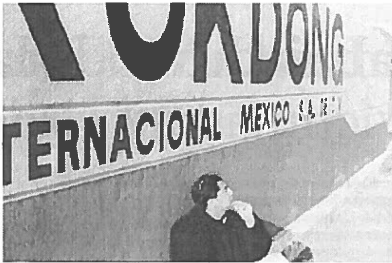
La fabrica Kukdong, acutalmente Mex Mode