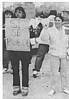
Trabajadores de Duro

Se ejerció una presión suficiente sobre el empleador y las marcas que se proveen en la fábrica para convencer a