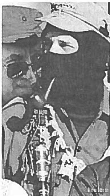
Izquierda: Subcomandante Marcos, vocero zapatista

En el estado de Chiapas, 20.000 maestros se declararon en huelga contra el PPP en junio, cuando se reunieron los presidentes de la región para declarar su apoyo al plan. Grupos políticos de izquierda en muchos de los países participantes han anunciado planes de formar un frente común contra el Plan. En noviembre grupos indígenas y de la sociedad civil se reunirán en Quetzaltenango, Guatemala, para planear estrategias.