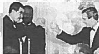
Abajo: Brindis de Bush y Fox.

Dirigente de la resistencia popular al libre comercio, como el subcomandante Marcos, de los zapatistas, prometen que el plan fallará porque la gente de la región no lo aceptará.