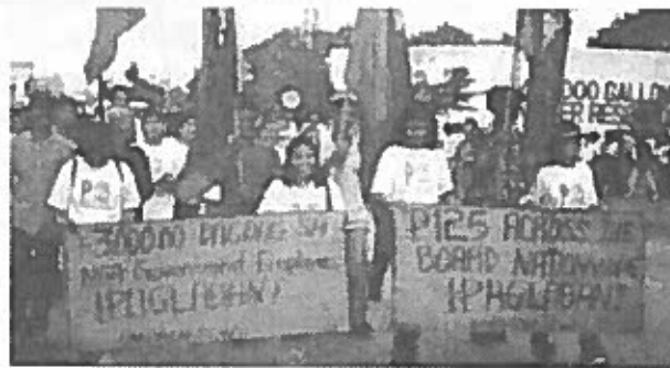
Trabajadores de Cavite realizan una protesta, 1999.

Luego de “vacaciones” forzadas de seis meses, los trabajadores de la fábrica Ultimate Electronics Components creen que la empresa reanudará operaciones solamente cuando