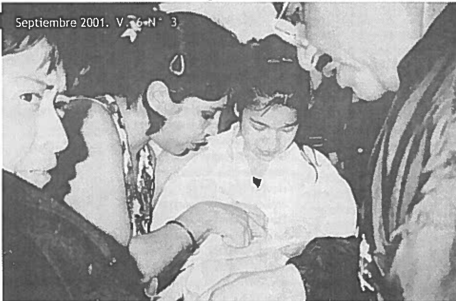
Trabajadores afiliándose al sindicato

El 18 y 19 de julio, miembros de los sindicatos de las fábricas textiles Choi Shin y CIMA, de Guatemala, fueron atacados en el trabajo por grupos organizados de trabajadores y supervisores antisindicales que exigían que renunciaran a sus trabajos y al sindicato.